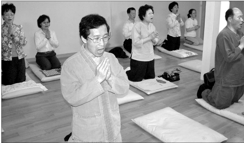
불력회 회원들이 염불정 정진에 앞서 장계를 하고 '나무아미타불'을 염하면서 정진을 기다리고 있다.

이에 귀종이 혀를 끌끌차며 말했다. “그런 소견머리로는 물 한 방울도 녹이지 못하겠소.” 그리고는 썩 하니 혼자 가버렸다. 복장 터지기 전에 차려려 떼버리고 각각 가는 게 서로를 위해 더 나은 일이다. 그런데 그 차는 어떤 지방에서 나온 차였을까? 용정차? 알 수는 없다. ■ 원철 스님(조계종 포교원 신도국장)