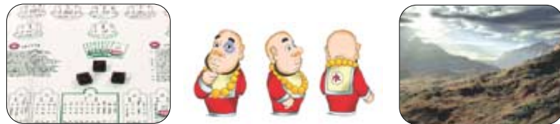
성불도 놀이판과 불패캐릭터.