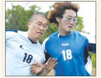
시방세계 9면 4대 종교인 축구대회 현장