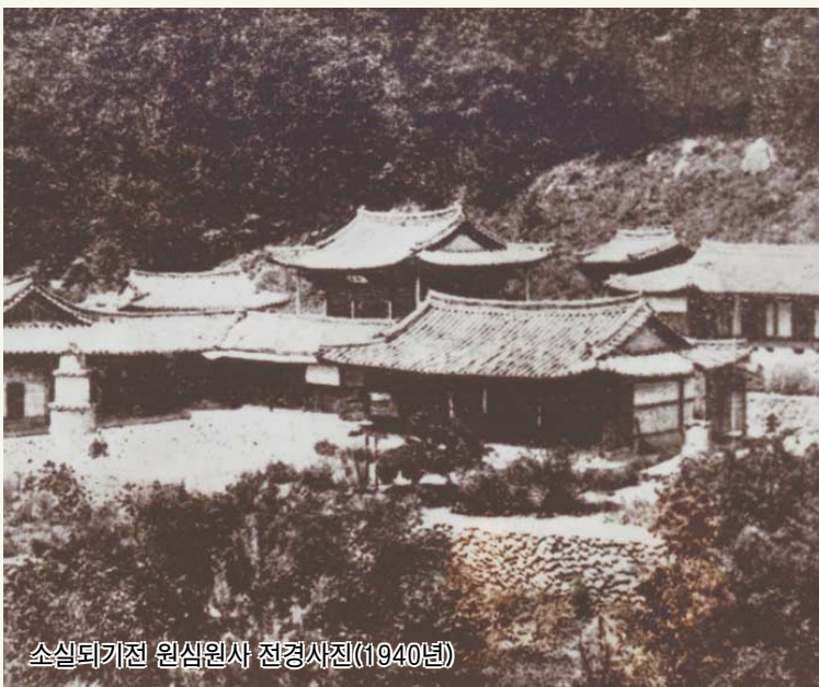
소실되기전 원심원사 전경사진(1940년)

연천 원심원사는 고구려 보장왕 6년(서기 647년)에 최초로 창건되어 6.25한국전쟁의 병화로 소실되기까지 약 1300여 년간 수많은 선지식들을 배출하였으며 역사적으로 유서 깊은 우리나라 최고의 지장성지로서 호국불교의 중심역할을 물론 중생들에게 무한한 귀의처가 되었던 민족의 성지였습니다. 이제 원심원사가 분단이 낳은 아픈 상처를 달고 반세기의 깊은 잠에서 깨어나 1300여년의 오랜 역사적 전통과 법맥이 계승되는 최고의 전법수행도량 및 호국영령을 천도하는 호국통일의 성지를 이루고자 복원불사의 큰 나래를 펼치고 있습니다. 먼저 호국보훈의 달을 맞이하여 그동안 심원사를 거쳐 가신 조사스님들을 비롯한 선지식들과 6.25한국전쟁을 비롯한 유사 이래 수많은 병란(兵亂)을 통해 산화한 호국영령 및 유주무주 고혼영가들을 천도하여 국태민안 및 남북평화통일을 발원하고 생지장도량인 보개산 원심원사 복원불사의 원만한 회향을 발원코자 이 성스러운 법회를 봉행합니다. 이 뜻 깊은 법회에 동참하시어 스님들과 함께 호국영령을 위해 금강경을 독송해 주시고 이 인연공덕으로 가내 평안하시며 구경성불하기를 발원합니다.