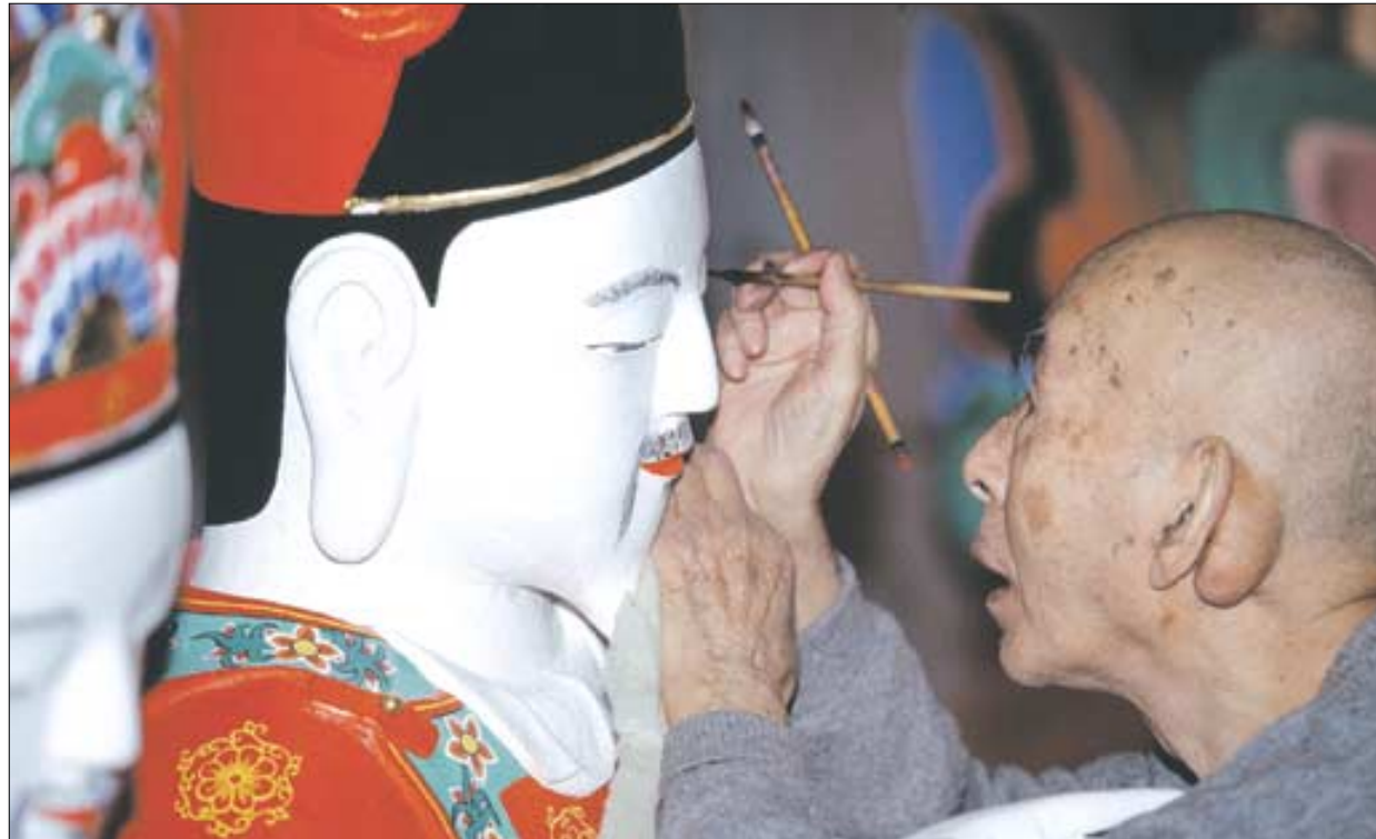
1999년 성북동 태고사 명부전 시왕상에 점안을 하고 있는 만봉 스님.

전 형태로 열렸다. 또한 같은해 명동유네스코 회관에서는 일본 전시 귀국작품전을 개최했다. 이후 81년 전통공예관(경복궁) 특별기획전에 이어 91년 일본 순회전, 97년 대구지역 순회전, 99년 부산지역 순회전, 2000년 분당전, 2002년 서울 관훈동 백악예원전, 2005년 서울중요무형문화재전수관 기획전 등 다수의 전시회를 열었다. 이렇게 만봉 스님은 국내외에서 한국 불교 미술의 우수성을 널리 알렸으며 그 공로로 1988년 은관문화훈장을 받았다. 주요 저서로 <만봉 이치호 단청전 작품집>이 있다.