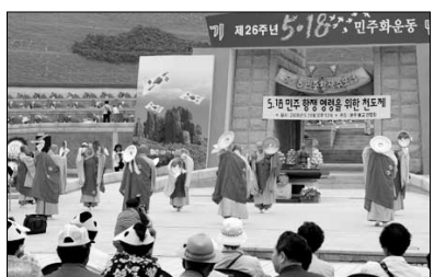
5·18 영가 극락왕생 기원 천도제 광주불교사암연합회(회장 해환)는 지난 5월 18일 광주 국립 5·18 묘역에서 '5·18

민주화운동영령을 위한 천도제'를 거행했다. 5·18 민주화운동 26주년을 맞아 열린 이날 천도제에는 태고종 광주전남 중무원장 금명, 광산구 불교협의회장 성오, 동구 불교협의회장 지각 스님 등 지역사암 스님 50여명과 5·18희생자 가족, 불자 등 300여명이 참석했다.