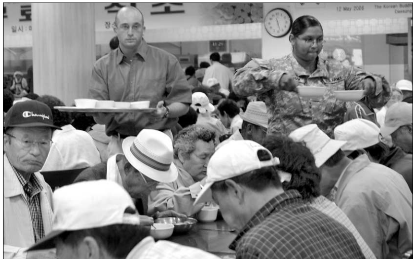
주한 미군들이 대성사가 마련한 급식소에서 배식을 하고 있다.