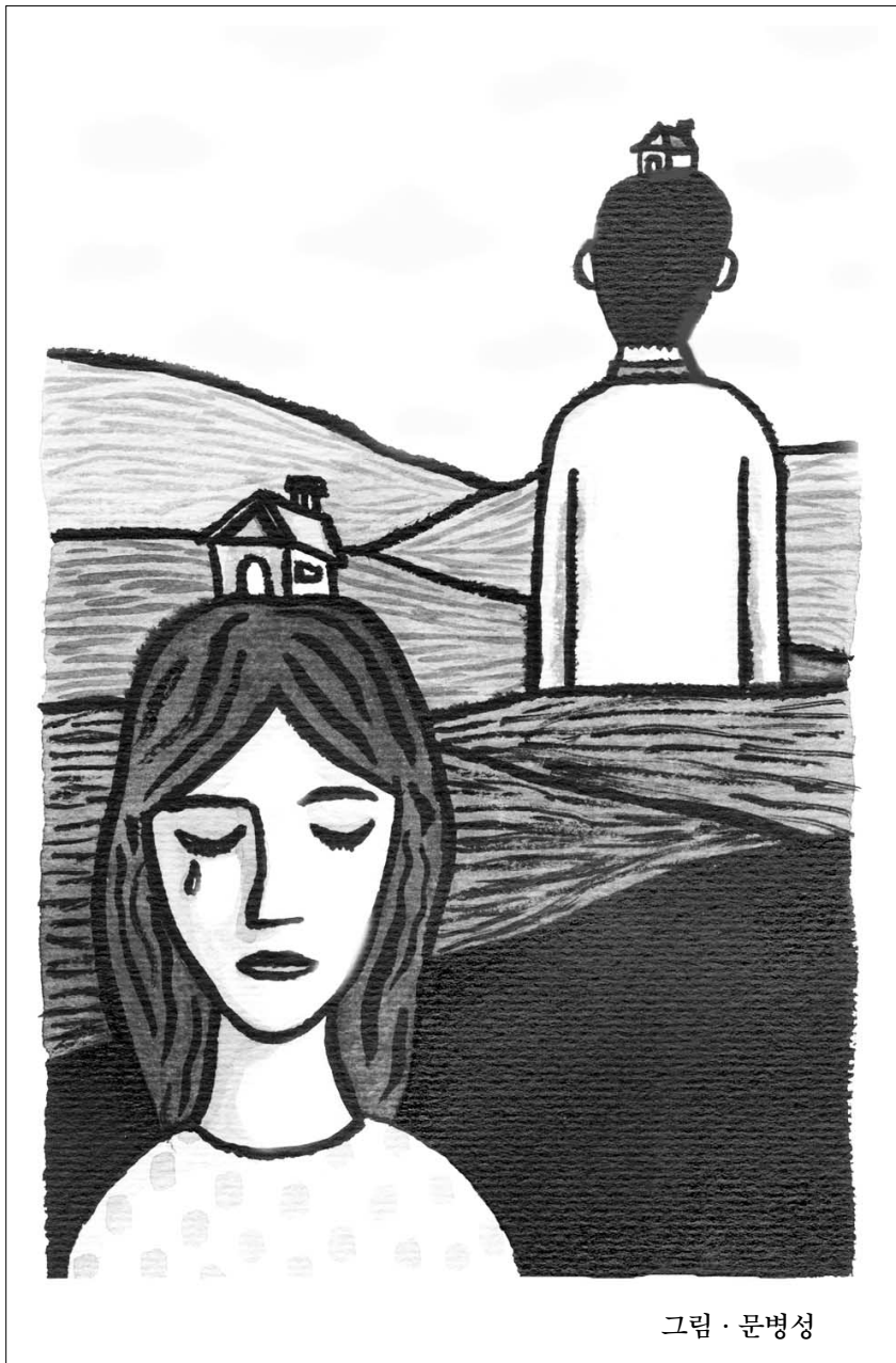
그림 · 문병성

그리고 이사를 했는데 우리 생활에도 아주 조금씩 변화가 찾아왔습니다. (계속)