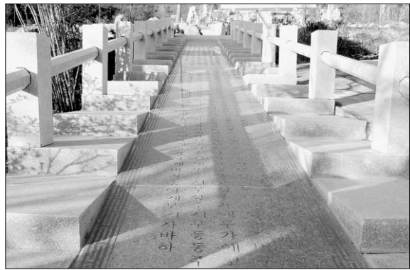
▲반야심경이 새겨진 석교.

석가모니불입상 등 여러 불보살상이 조성되어 집안을 했으며 석조5백 나한도 도랑에 가득 모셔졌다. 3층석탑과 13층 석탑 등 다양한 탑도 도랑 여기저기에 솟아 있다. 100만 포기의 철쭉을 심어 봄이면 온통 꽃궁전을 이루어 극락세계를 연상케 한다.