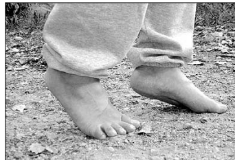
④ 까치발로 걷기