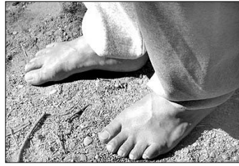
① 두꺼비처럼 천천히 걷기