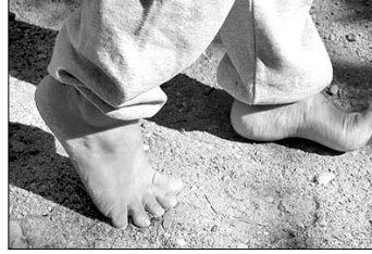
② 황새 같이 날렵하게 걷기