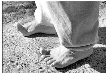
③ 잇몸을 우물거리듯 걷기