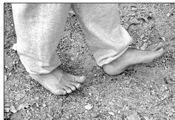
⑥ 가재처럼 뒤로 걷기