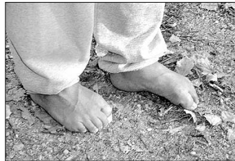
⑤ 주먹을 얹어 놓는 듯 걷기