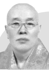
編·著者 法眞 辛承都 나무마하얀바라밀