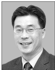
박명호 동국대 정치외교학과 교수