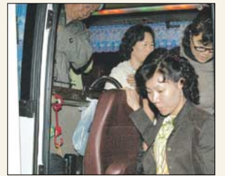
시방세계 9면 조계사 '도로 가는 버스'