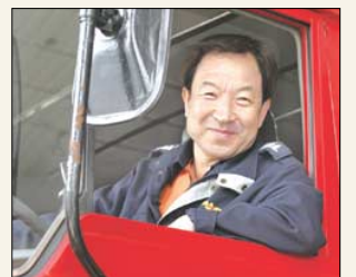
도반의 향기 17면 '119 선생님' 안시장 소방관