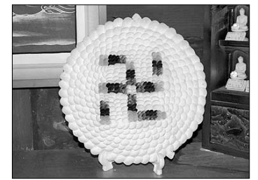
조개껍질로 만든 만(萬)자 장염물.