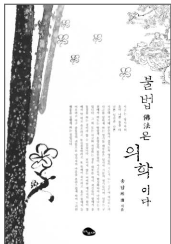
신국판 | 319쪽 | 값10,000원