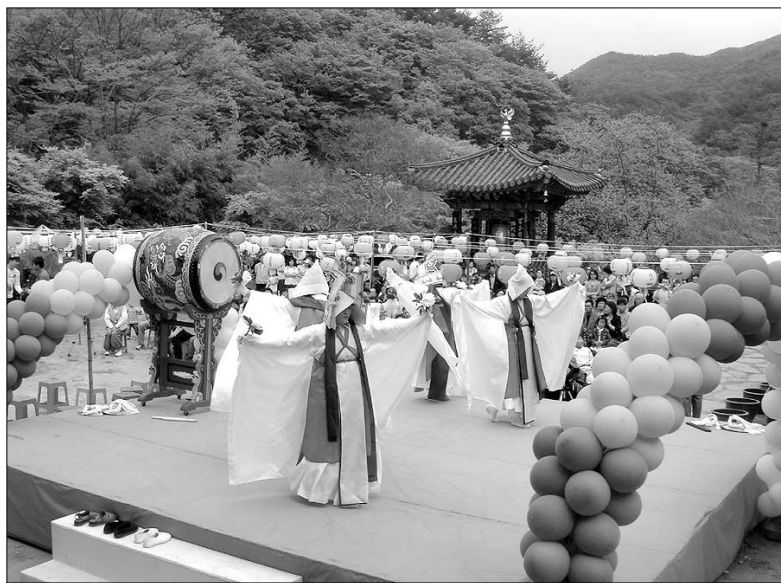
불교무용단 한꽃예술봉사단이 창단에 앞서 5월5일 부처님오신날 보성 대원사에서 공연하고 있다.