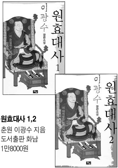
원효대사 1, 2 춘원 이광수 지음 도서출판 화남 1만8000원

장엄하고 넉넉한 신라의 풍경과 대자유한 민족의 부처, 원효의 일생을 소설화한 춘원 이광수의 대표적 장편소설 <원효대사 1, 2>가 재출간됐다.