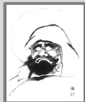
달마도 大 / 10만원 달마도 小 / 5만원