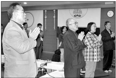
울 2월 열린 전국교사불자련연합회 정기총회.

교사불자련 16개 광역시·도에 지부 창립 출범 9년만의 결실... 조직 강화 박차