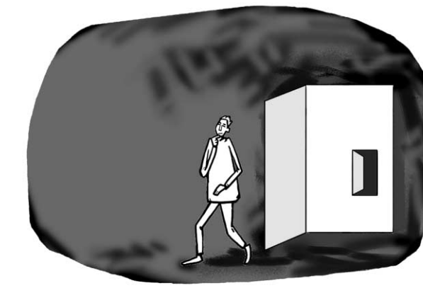
그림 · 최추현