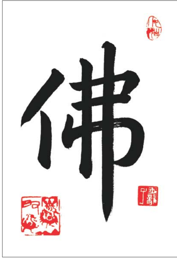
왕희지 서법 '佛' 육룡자 스님 작품.