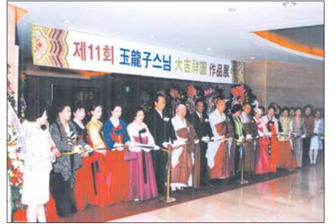
제11회 석산 육룡자 스님 대길상도 작품전 테이프 커팅 모습.