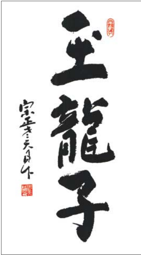
대한불교조계종 제9대 종정을 역임하신 월하대종사筆.

11주년 맞아 국내외 각계인사 1만여명 동참, 국내 최대 불교미술대제전으로 확고히 ‘자리매김’