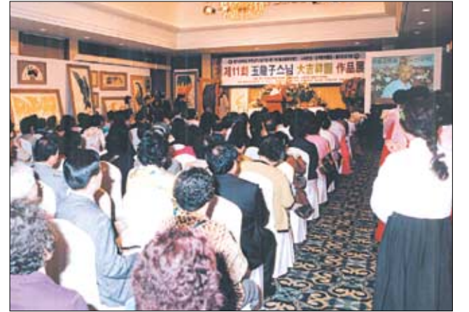
연일 행사를장을 가득 메운 불자들.