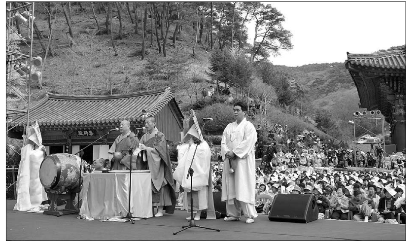
고운사가 창건 1325주년을 기념해 마련한 산사음악회가 지역불자들에게 큰 호응을 얻었다.