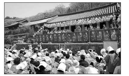
발전으로 들뜨기 쉬운 시대를 살고 있지만 곁을 잃어 하나도 가벼이 하지 않고 정진하는 불자가 되어달라”고 당부했다.

이날 보성 스님은 법어에서 “부처님은 물론 개산조 보조국사를 비롯한 16국사의 가르침도 잊지말아야한다”고 강조하고 “과학