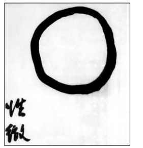
성철 스님 작 '일원상'.

'김생, 영파, 만공, 만해, 동산, 청담, 성철, 서운...' 한국고승 44명의 수행 정취를 한 눈에 접할 수 있는 유물전이 열린다. (사)우리는선우 제천지회(공동 대표 이위순, 김연희)는 '크신 발자취 천년 묵 향기 안고 오시네'를 주제로 5월 1일 제천시민회관 제1·2 전시관 및 광장무대에서 한국불교 1600년을 대표하는 역대 고승들이 남긴 글씨와 그림, 행장 등을 선보인다.