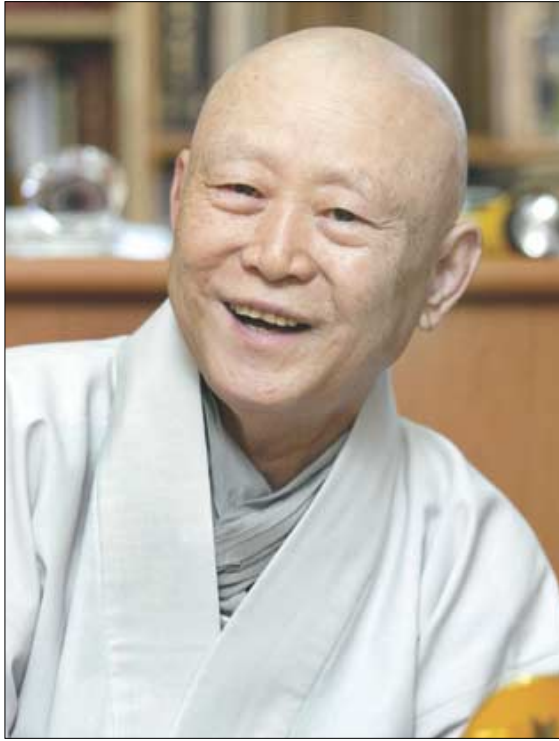
천운 스님은 "모든 허물은 자신에게 있음을 알아야 한다"고 강조했다.

공부 했나 안 했나 화내는 것 보면 알아 스스로 마음 다스리며 자비 실천하세요