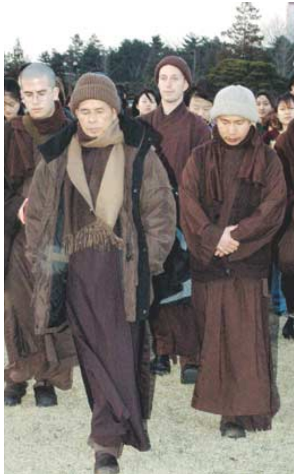
틱낫한 스님이 제자들과 함께 걷기명상을 하고 있다.

스님은 "좋은 생각은 좋은 행동을 이끌고, 좋은 변화를 불러온다. 기도는 그 과정에서 좋은 변화를 이끌어주는 선순환의 도구"라고 설명한다.