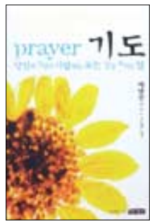
기도 틱낫한 지음 | 김은희 옮김 | 명진출판 | 9000원

불확실한 세상을 살아가는 사람들에게 기도는 마지막 희망이다. 그래서 기도는 내 자신과 내가 사랑하는 모든 것을 지키는 힘이다. 그럼에도 불구하고 기도가 이루어지지 않았을 때 믿음은 의문으로 바뀌고 대상에 대한 확신은 흔들리게 된다.