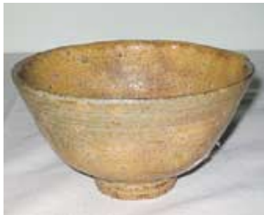
이동규씨 작품 '이라보 찻사발'

시상식은 5월 7일 '문경 한국전통찻사발 축제' 폐막식 때 열릴 예정이다. (054550-6395)