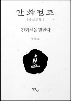
간화정로 월암 스님 지음 현대북스 1만8000원