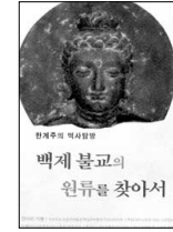
백제 불교의 원류를 찾아서 한계주 지음 세존 1만2000원