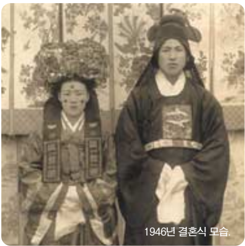
1946년 결혼식 모습

사장 부부. 일본군 1기로 징집돼 징병검사를 받았는데 기병(騎兵)하는 병사로 판정난 주 이사장. 여차피 전쟁에 나가면 죽을 수도 있고 그러면 아내가 생과 부 될 것 같아 20세가 넘어도 결혼을 하지 않았다.