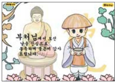
부다피아 e-card 메신저(사진 위)와 샌드 투유에서 서비스중인 봉축 e-card.

서울 양평동에 거주하는 주부 문경의 (37)씨는 부처님오신날이면 어김없이 봉축 e-card를 보낸다. 크리스마스카드를 보내는 것처럼 부처님오신날의 의미를 주변사람들과 다시 한번 되새기고 싶어서다.