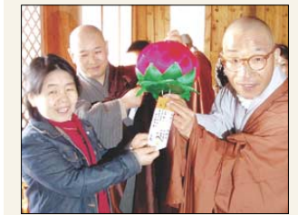
시방세계 9일 장애인불자들 금강산행