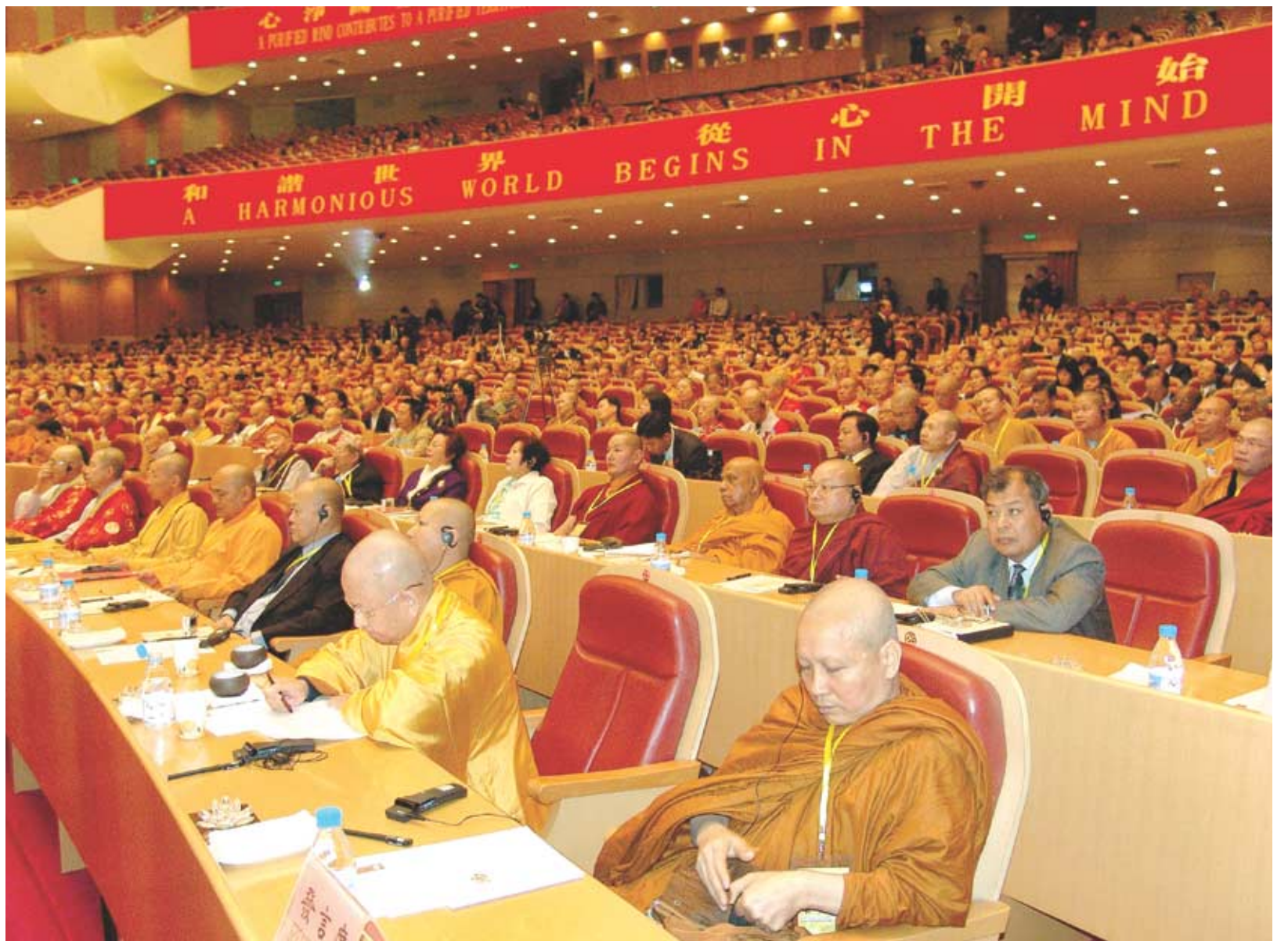
개막식 첫날인 4월 13일 세계 34개국에서 온 1천여명의 불교도들이 각국 대표들의 기조연설을 경청하고 있다.