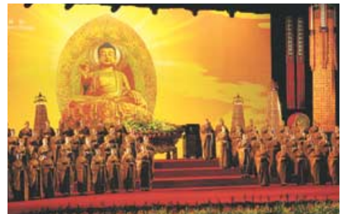
4월 13일 개막식에 앞서 중국불교협회 소속 1백여 스님들이 예불의식을 하고 있다.