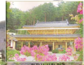
화장사 사찰 전경

• 유물 기증 및 후원안내 다선식 박물관을 후원하는 것은 인류의 풍요로운 정신세계에 투자하는 것입니다. 유물기증 및 기금후원을 통해 박물관 건립에 동참할 따뜻한 손길을 기다립니다. • 유물기증 : 다선식 박물관에 전시할 각종 대부 및 도자기, 선사시대 유물(세화포함), 취사도구 등을 유상, 무상, 임대등의 형태로 기증을 받으시거나, 무상원예의 경우 기증자의 이름을 동판으로 제작해 명예의 전당에 전시하게 됩니다. 기증을 원하시는 분은 먼저 기증사와 유물물관 관련 추진경과에 따라 신청이 우선입니다. • 기금후원 : 다선식 박물관은 대한불교조계종 화장사기 부처님 재영하고 각종 기금을 지원받아 건립하게 됩니다. 건립에 따른 주요 예산금·도박이 되었지만 여러분의 뜨겁고 성실한 마음이 모여 전대 크건일이 완공될 수 있습니다.