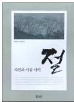
자연과 사람사이 절 윤재학 지음 명상 1만3500원

그가 책의 서두에 어떤 이유로 절을 찾든, 절집에 머무는 동안 만큼은 '공부하지 마세요'라고 말해 독자들을 당혹스럽게 하는 것도 이 때문이다. 보통 절의 존재의미를 새기는 방식에 대해서는 사람마다 다르다. 어떤