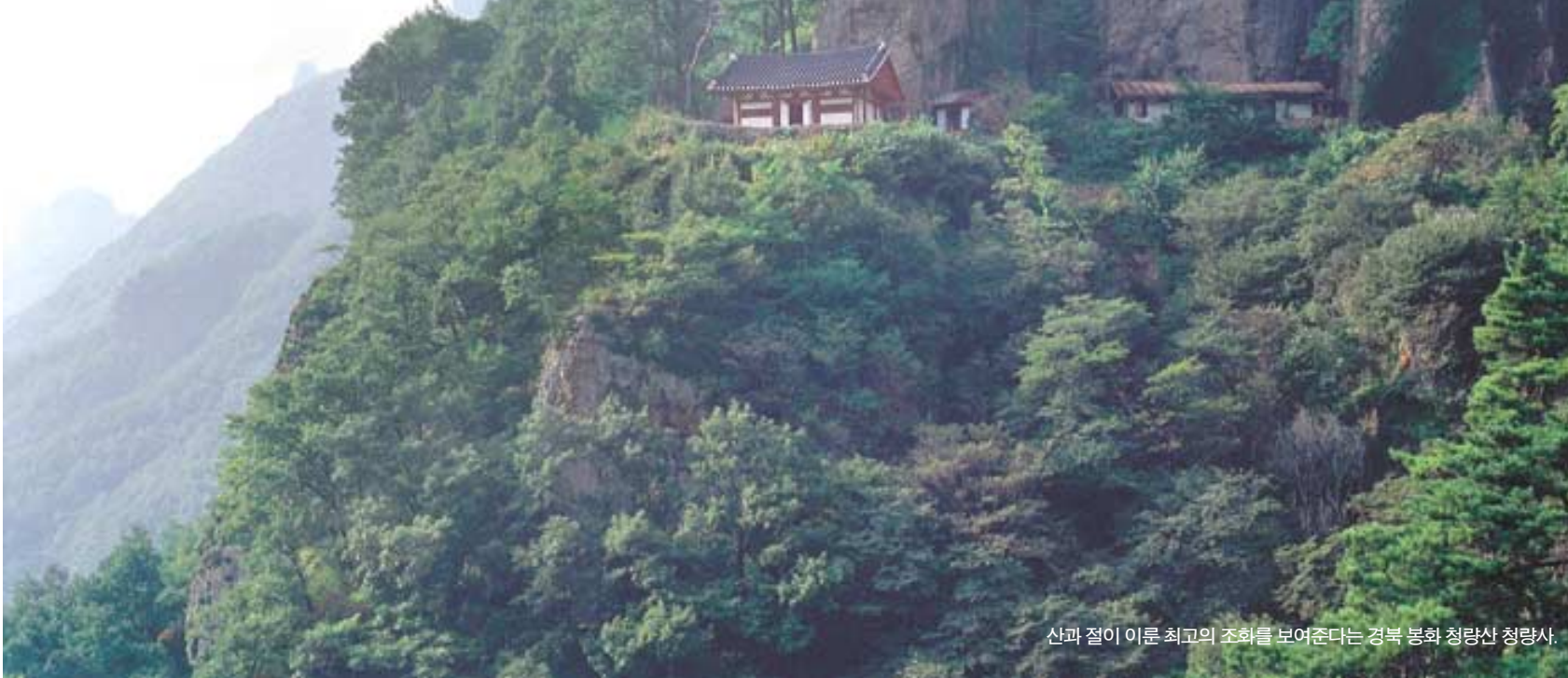
산과 절이 이룬 최고의 조화를 보여준다. 경북 봉화 청량산 청량사.

"절로 가는 길은 곧 산으로 가는 길이고, 산으로 가는 길은 또한 절로 가는 길이다. 산과 절은 구름과 비의 관계처럼 서로를 내포한다. 마치 바위나 구름처럼 산의 일부로 존재하는 절은 그곳으로 발길을 한 사람들이 절로 자연의 일부가 되게 한다. 가장 자연화된 인간의 거처, 절은 그런 곳이다. 절은 지음(知音)이다. 산에 절이 있어 우리는 비로소 자연의 내밀한 풍광 속으로 들어설 수 있다."