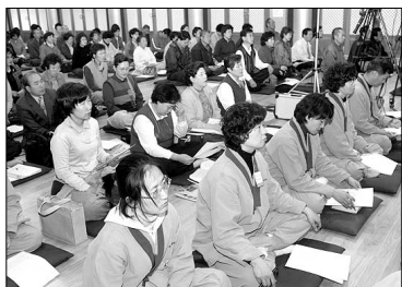
월정사 화엄산림에 참가한 사부대중.

오대산은 전통적으로 문수도량이라고 불리고 있습니다. 문수보살은 보현보살과 함께 화엄삼성(華嚴三聖) 중 한 분이시지요. 그러나 오대산은 화엄도량이라고도 부를 수 있겠습니다. 이렇게 지역적으