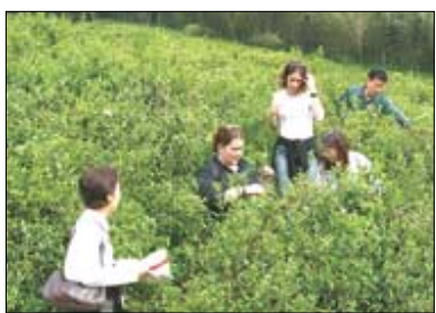
첫잎 따기 체험을 하는 외국인들.

가족과 함께 봄나들이 가기 좋은 때다. 4월 20일 곡우를 앞두고 한창 새싹을 내미는 차밭을 거닐어 보거나 가족, 연인과 함께 첫잎을 따서 차를 만들어 보는 건 어떨까? 직접 딴 차는 그 어떤 '명품 차'도 흉내낼 수 없는 맛과 향을 선사할 것이다. 차밭기행과 제다체험을 해볼 수 있는 곳을 소개한다.