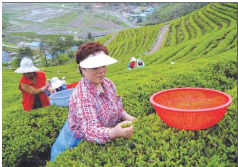
울 봄에는 보드라운 첫잎을 따서 '나만의 차'를 만들어 보는것은 어떨까?

가족과 함께 봄나들이 가기 좋은 때다. 4월 20일 곡우를 앞두고 한창 새싹을 내미는 차밭을 거닐어 보거나 가족, 연인과 함께 첫잎을 따서 차를 만들어 보는 건 어떨까? 직접 딴 차는 그 어떤 '명품 차'도 흉내낼 수 없는 맛과 향을 선사할 것이다. 차밭기행과 제다체험을 해볼 수 있는 곳을 소개한다.