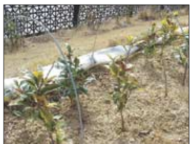
국립경주박물관은 4월 3일 야외정원에 차나무 700주를 심었다

국립경주박물관(관장 김성구)은 식목일을 앞둔 4월 3일 박물관 야외정원에서 차나무 묘목을 심는 '푸른 차(茶)나무와 함께하는 국립경주박물관' 행사를 개최했다.