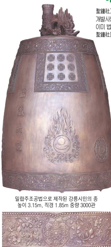
밀랍주조공법으로 제작된 강릉시민의 종 높이 3.15m, 직경 1.85m 중량 3000kg

聖鐘社가 지난 2004년 중소기업청이 전개하는 기술혁신 개발사업에 통해 본사 전매특허인 蠟燭鑄造工法으로 10,000년 이상의 초대형 범종까지 제작할 수 있게 되었습니다. 이미 범종장에서 입증된 성종사 작품종의 섬세한 문양과 부드러운 소리를 이제 大鐘에서도 만나보실수 있습니다. 聖鐘社는 최고의 범종 제작을 위해 항상 연구 노력하고 있습니다.