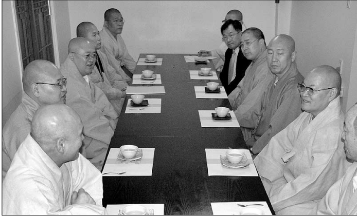
〈태고종사〉 발간에 따른 갈등을 해소하기 위해 조계(왼쪽)·태고 양종단 대표가 4월 7일 첫 모임을 가졌다.

‘태고종사’ 관련 조계·태고종 공사 첫모임 태고종 “교정판 제작할 뜻 있다”