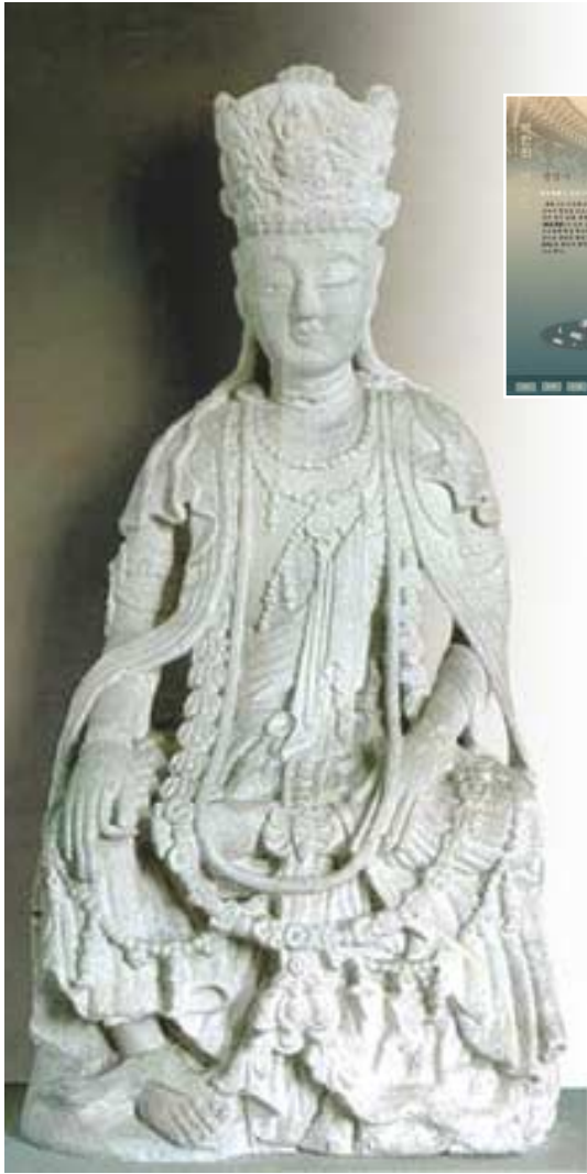
개성 관음사 관음보살상