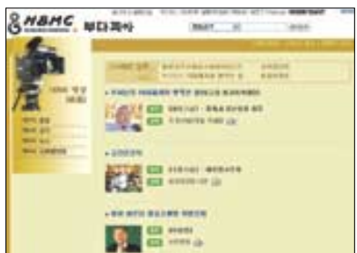
부다피아 HBMC 강의 코너