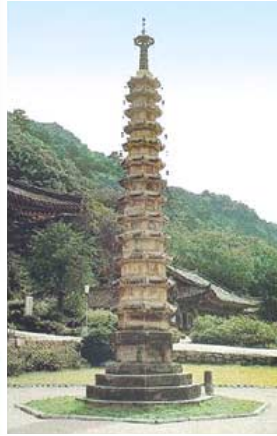
보현사 8각 13층석탑

북한에는 국보급 전통사찰이 몇 곳이며 어떤 성보문화재가 있을까? 이에 대한 명쾌한 해답을 주는 사이트가 있어 화제다. 북한문화재자료관(http://northunicp.go.kr)은 최근 ‘북한의 옛 사찰’ 코너를 개설하고 북한이 국보로 지정한 평양시 광범사, 법운암, 황해도 성불사 등 39개 사찰의 전각과 성보문화재의 정보를 제공하는 서비스를 시작했다. 국립문화재연구소(소장 김봉건)가 2004년 일반인에게 북한 문화유산을 쉽게 접근