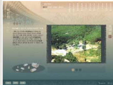
‘북한의 옛사찰’ 홈페이지