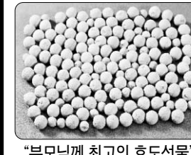
"부모님께 최고의 효도선물"