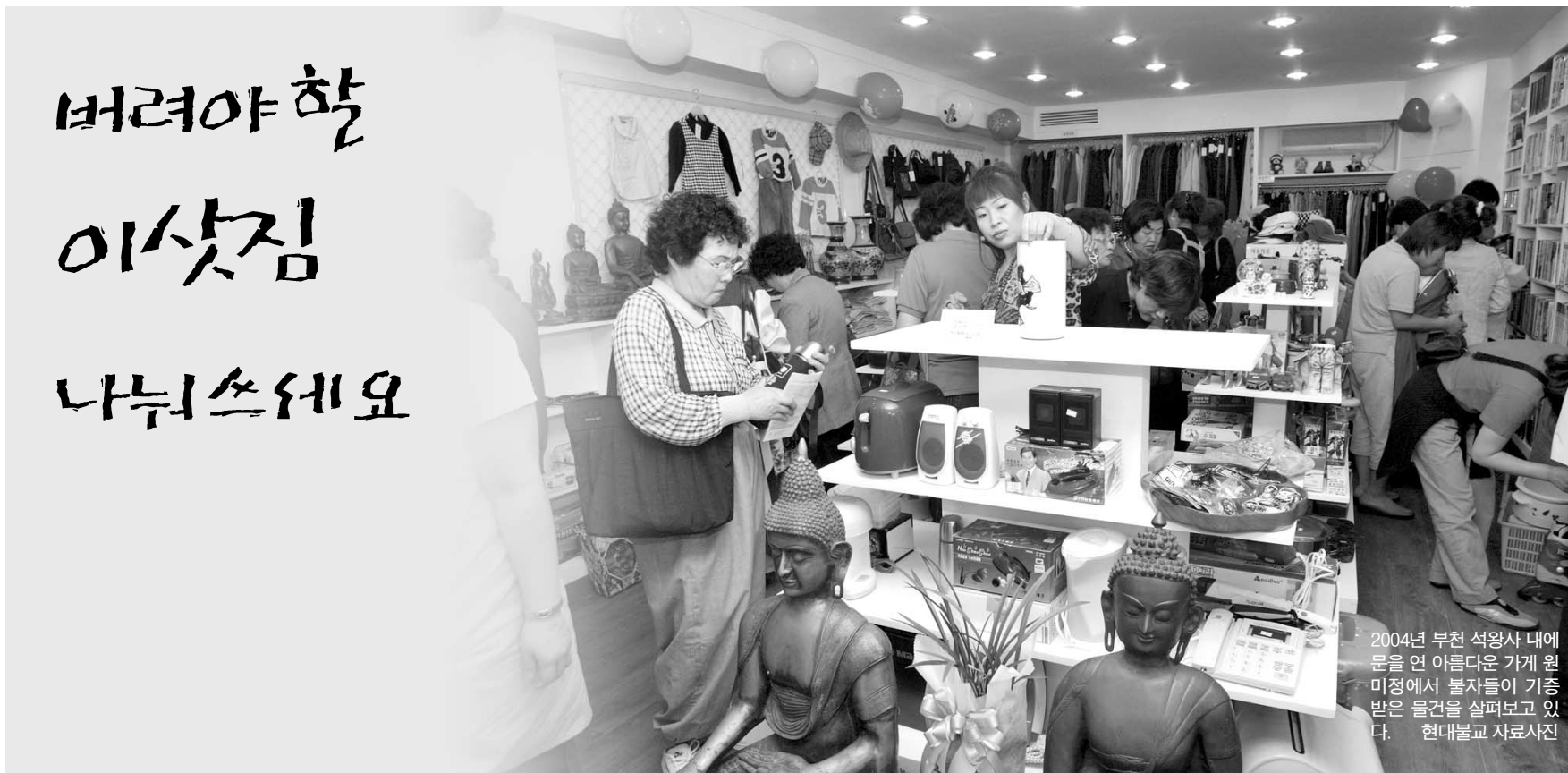
2004년 부천 석왕사 내에 문을 연 아름다운 가게 월빙에서 불자들이 기증 받은 물건을 살펴보고 있다.