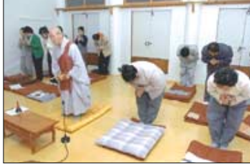
불자들과 함께하는 새벽 예불. 한번도 거르지 않는다.