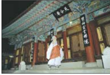
새벽 2시의 도량석. 활안 스님이 직접 하신다.