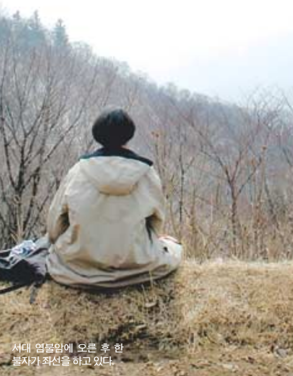
서대 염불암에 오른 후 한 불자가 좌선을 하고 있다.