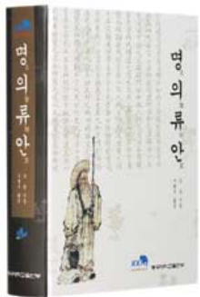
명의류안(名醫類案) 강관 지음 | 구병수 옮김 동국대출판부 | 16만원