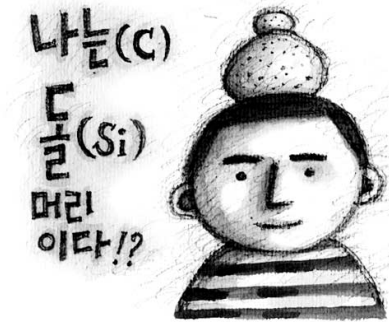
그림 : 문병성