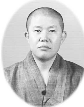
現관 신선암 주지 現神 임상최면 협회장 現참 선공 협회장 現神 치유명상 협회장