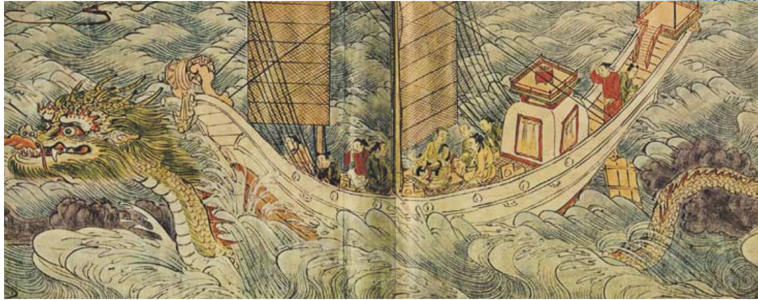
그림3 : 용으로 변한 선묘가 의상이 탄 배를 수호한다