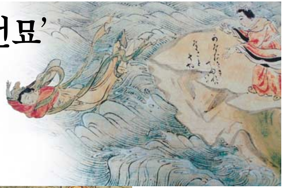
그림2 : 바다에 투신하는 선묘

'의상도'의 설화는 '송고승전(권4)'에 수록된 '당신라국의상전(唐新羅國義湘傳)'에 의거한 것입니다. 당에 막 도착한 수려한 모습의 의상법사를 보고, 마을의 단아하기로 이름 높은 선묘라는 규수는 곧 마음이 흔들리게 됩니다(그림1). 그러나 "나는 부처님의 계율을 지키며 신명은 그 다음으로 했다"라는 의상의 강직한 말을 듣고 애심은 신심으로 바뀌