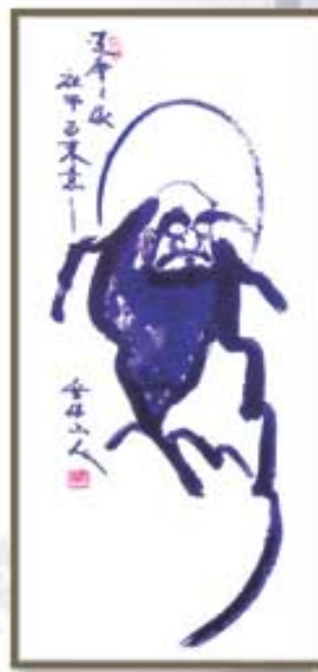
●선묵 한지 달마도 ●30×130cm