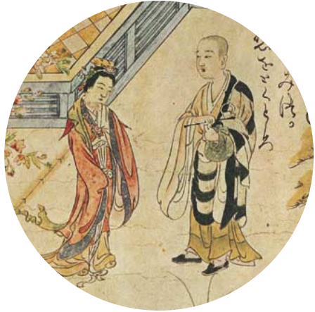
그림1 : 자신의 설레임을 고백하는 선묘. 의상은 매우 곤란해 하는 눈치다.

“어, 어라? 아아- 경술허려라. 저게 무슨 짓인가” 〈의상도: 제3권 제1단의 화기〉