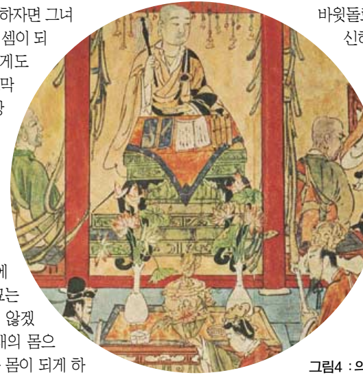
그림4 : 의상의 부석사 대설법 장면