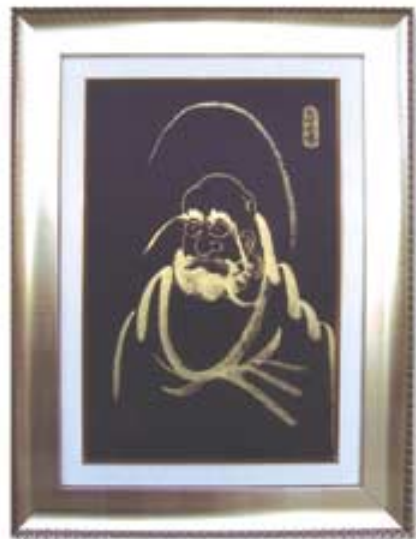
●금니 달마(금가루) 138,000원(3개월카드무이자) ●37×50cm

새집입택, 신장개업, 사업성취, 수맥차단, 건강학업 등 달마도를 소장하시고 굳은 원력의 심신으로 "나는 왜 존재하는가?" 라는 화두로 무한존재의 위대한 자기를 깨치시기 바랍니다.