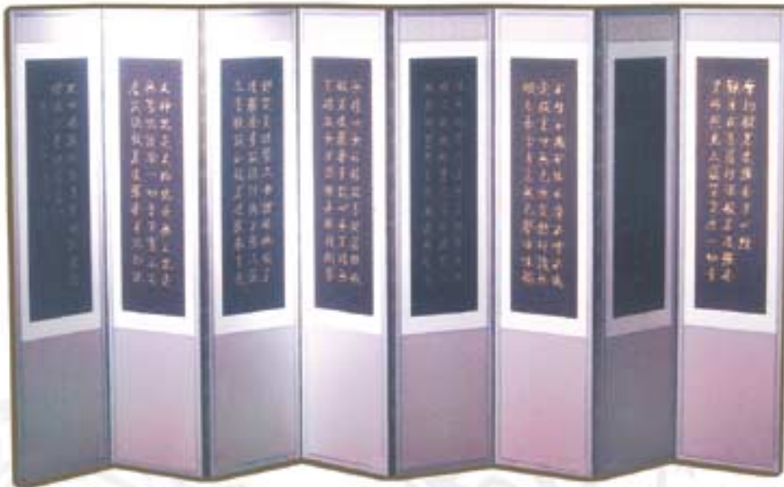
●금니 반야심경 8폭병풍 999,000원(6개월카드무이자) ●360×137cm ●병풍구입시 금니 달마 1점 선물