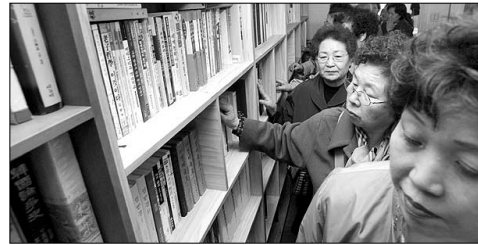
중성문고를 둘러보는 임재선원 불자들.

<한글 대장경>(동국역경원)은 물론 <속장경>(홍콩 불서출판공사), <대정신수 대장경>(대정출판사), <남