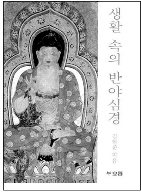
생활속 반야심경 김현준 지음 호림 | 6000원

포교지인 월간 <법공양> 8만부를 제작해 전국의 불자들은 물론 군법당 교도소 병원에 보내고 있는 불교신행연구원 김현준 원장이 <생활속의 반야심경>을 발간했다. 이 책은 2005년 2월부터 2006년 1월까지 총 12회에 걸쳐 월간 <법공