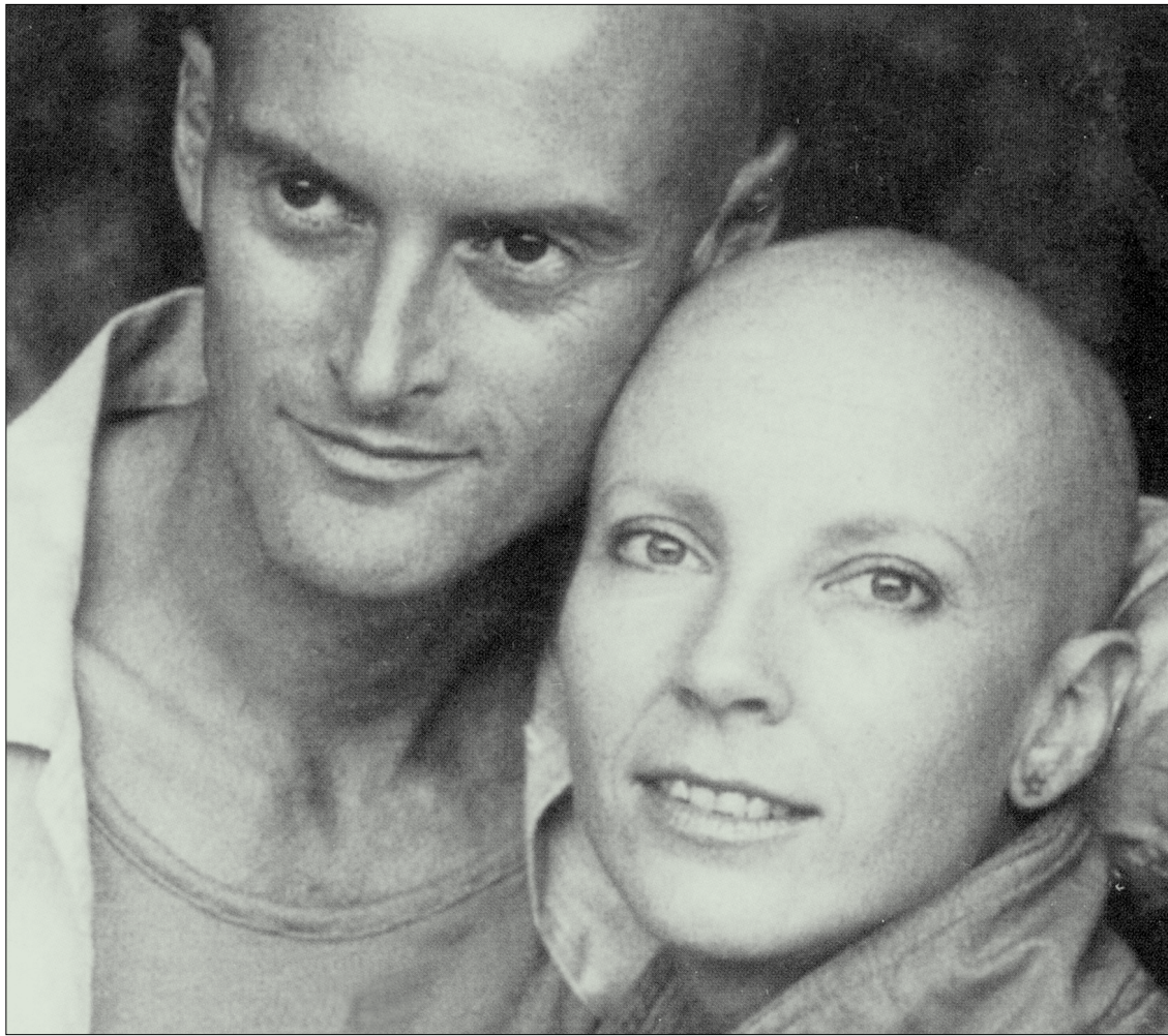
선과 티베트 불교의 수행자이며 세계적 지성으로 평가받는 켄 윌버와 그의 아내 트레아(오른쪽).