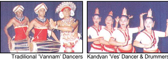
Traditional 'Vannam' Dancers Kandyan 'Ves' Dancer & Drummers

스리랑카 정부의 지원과 국제불교 교류협회의가 소망하는 국립무용단의 대표적인 춤 캔디안 댄스 - 캔디안 댄스는 스리랑카 캔디왕국(1597년-1815년)의 통치자의 후원 아래에서 번영을 이룬 고전적인 춤이다. 스리랑카의 독특한 세가지 전통춤 중 하나이며 매우 정교한 의상과 드럼, 작은 심벌로 연주하는 고도로 발달된 리듬으로 관객을 사로잡는 매력을 지니고 있다.