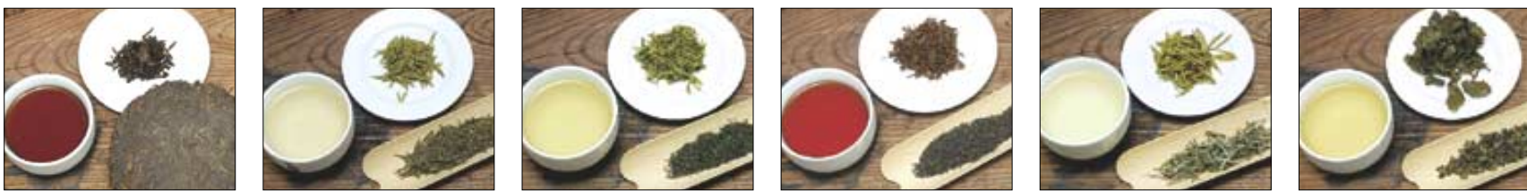
왼쪽부터 흑차 황차 녹차 홍차 백차 청차.