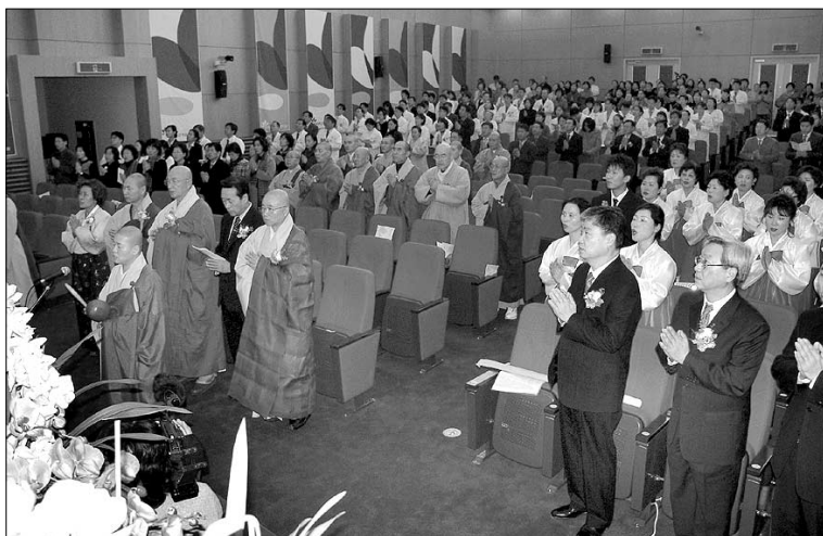
대학병원 불심이 연초부터 거세게 일고 있다. 사진은 1월25일 동국대 일산병원 '연우회' 창립 법회 봉행 모습.

이런 가운데 대학병원 불심을 제대로 이끌어가기 위한 불교계의 다각적인 노력도 모아지고 있다. 특히 동국대, 서