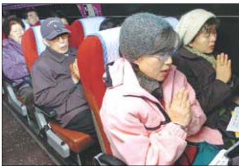
조계사 신도들이 서울을 출발해 봉암사로 가는 버스 안에서 새벽예불을 봉행하고 있다.