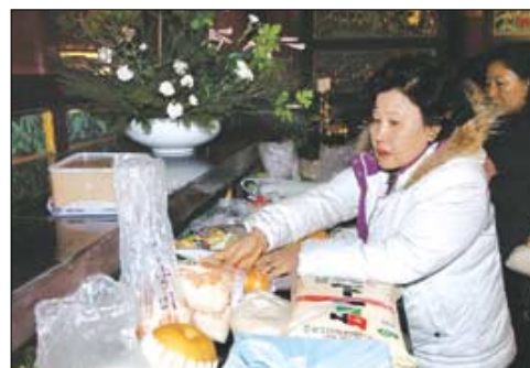
한 신도가 대웅전 불단에 공양물을 올리고 있다.