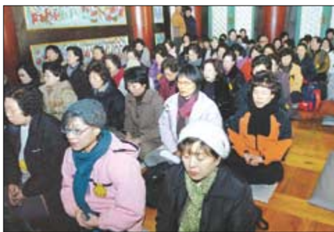
대웅전에서 법문을 듣기전 잠시 선정에 든 신도들.