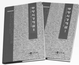
◇ 무량의 경 I / II ◇ 신국판 양장 각권 : 18,000원

『묘법연화경』 내(內)에는 제일(第一)의 법(法)과 제이(第二)의 법(法)이 있음을 부처님께서 밝히고 계신다. 이러한 제일(第一)의 법(法)이 보살도(菩薩道)를 위한 (우주간의 법)이며 제이(第二)의 법(法)이 현재 문자(文字)로 전하여진 경(經)으로써 이를 《세간법(世間法)》이라고 한다.