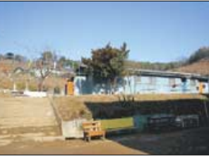
오는 3월 헐리게 될 호국 총절사. '마지막 수계법회' 돌격대대 불자 장병들은 1월 15일 수계법회를 봉행했다(왼쪽).

도 있지만 오늘이 마지막 법회가 아닐까 하는 생각이 앞서서다. 한배 한배 절을 올리는 장병들의 마음에는 또다시 부대 법당에서 법회를 보았으면 좋겠다는 염