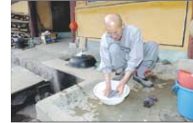
생활이 곧 수행인 정무 스님은 아직도 손수 빨래를 하신다.