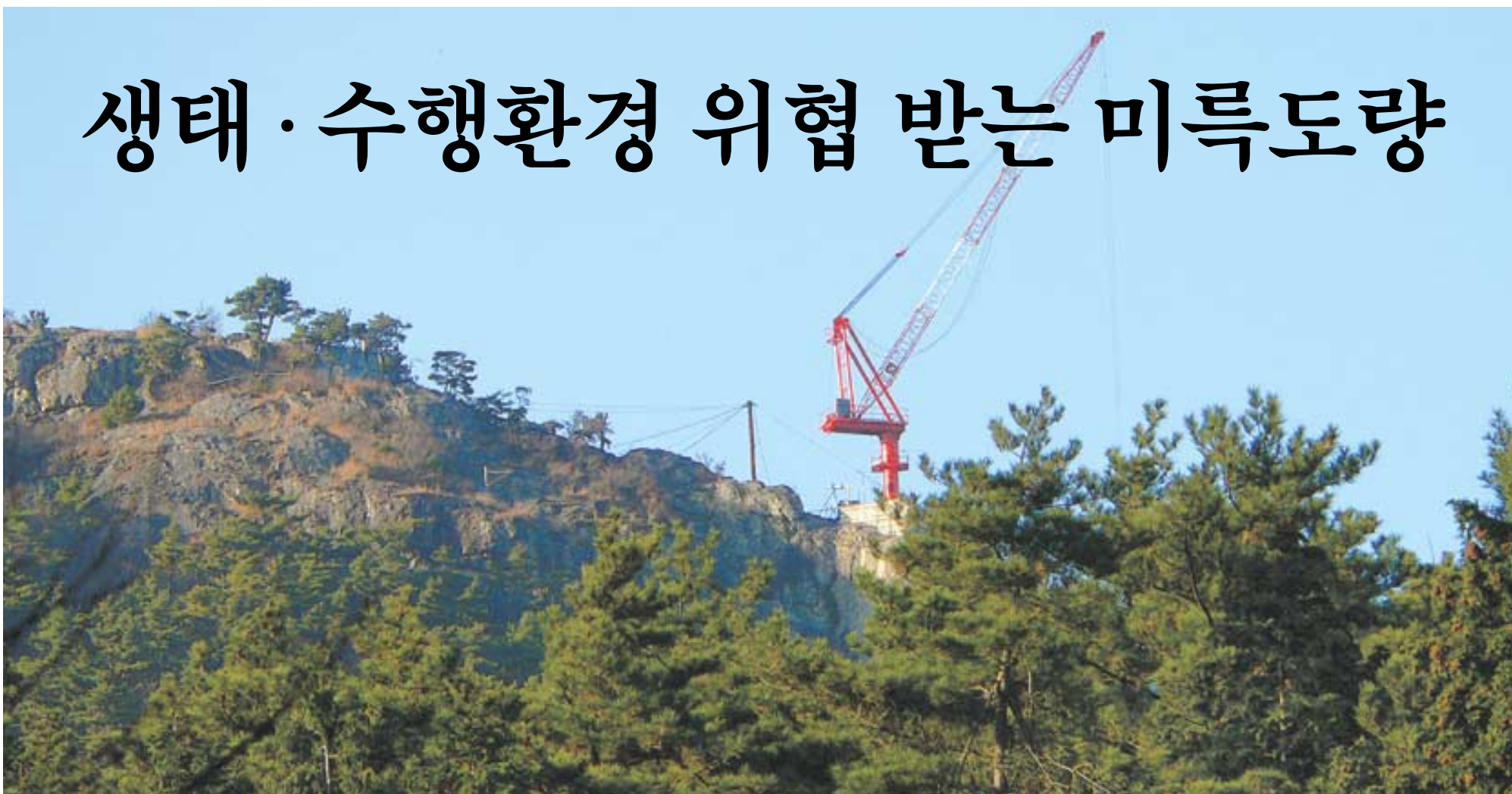
통영시는 상부 정류장 부지 소유자인 용화사와 조계종단의 허가를 얻지 않고 케이블카 건설공사를 강행하고 있다. 8부 능선에 자리한 탑크레인은 미륵산의 풍광을 해치는 주범이다.