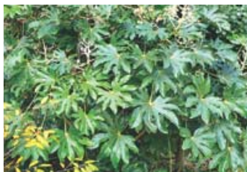
팔손이나무는 남해안 곳곳에 자생하는 난대수종이다.