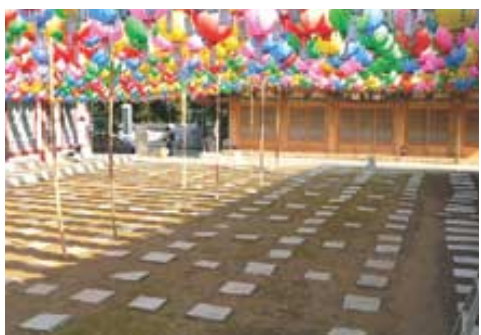
용화사는 마당에 네모난 돌을 바둑판처럼 깔아 놓았다.

절명굴이 광합성만을 방해한다면, 송악은 거기에 다 수분과 양분까지도 착취하기 때문에 송악의 공격을 받은 나무는 고달프기 그지없다.