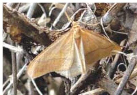
참나무겨울자나방은 주로 활엽수가 많은 숲에 나타나며, 날개 길이는 약 4cm 정도에 연황색을 띠고 있다.