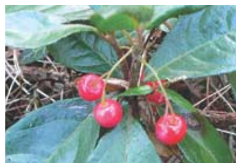
지금우는 키가 30cm에도 못 미치는 난쟁이 나무이다.

도솔암은 효봉(曉峰) 선사(6·25 전쟁때 상좌인 구산(九山) 스님을 데리고 머물면서 후학을 지도했던 곳으로도 유명하다.