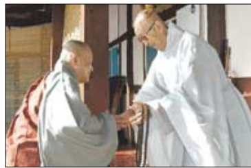
고불총림 백양사를 방문한 조계종 총무원장 지관 스님(왼쪽)을 반갑게 맞고있다.