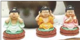
수산 스님 방에 모셔진 ‘눈기리고 귀귀고 입입’ 세 분의 부처님.

수산 스님의 가르침 이번 안거기간에는 유난히 눈이 많이 내립니다. 눈 빗자루 들라, 화두 들라 여느 때보다 바쁜 때입니다. 몸이 부산하다고 마음까지 멍달아 날뛰어서는 안됩니다. 눈을 치우는 순간에도 화두를 놓지 않았을 때 공부는 다른 월보다 크게 진전될 것입니다. 공부는 안거에 들어간 수좌들만 하는 것이 아닙니다. 재가불자뿐 아니라 인류가 다같이 자기 자성을 돌아보아야 합니다. 이 공부는 세상에 태어난 것을 알고, 웃(육신)을 벗어 버릴줄 아는 공부입니다. 이것을 일러 부처님은 ‘일대사 인연’이라고 하셨습니다. 우리는 무심코 태어난 것이 아니고 인연따라 온 것입니다. 밝게 태어나서 밝게 살다가 밝게 가는 것’이 부처님이 우리에게 주신 가르침입니다. 우리는 전생에 오욕이 툭 떨어져 밝게 살았기에 인간으로 나왔습니다. 그 인연으로 밝게 닦고 살다가 좋게 가야하는데 사람 몸을 받고서는 삼독에 빠져 버리곤 합니다. 밝게 왔건만 어둡게 살다가 어둡게 가는 것입니다. 공부는 어둡게 살고 어디로 가는지도 모르는채 가지 않도록 하기위해 하는 것입니다. 바로 ‘자성을 돌이켜 보는 공부’입니다.