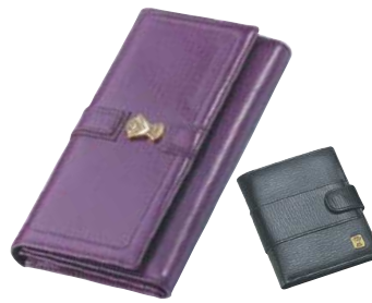
여성용 황나노장지갑 (진도라세)