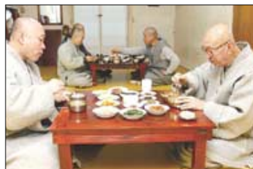
철저하게 소식(小食)을 실천하는 수산 스님.