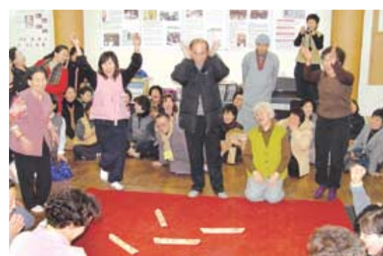
대구 영남불교대 경산도량 불자들은 웃놀이를 하며 화합을 다졌다.