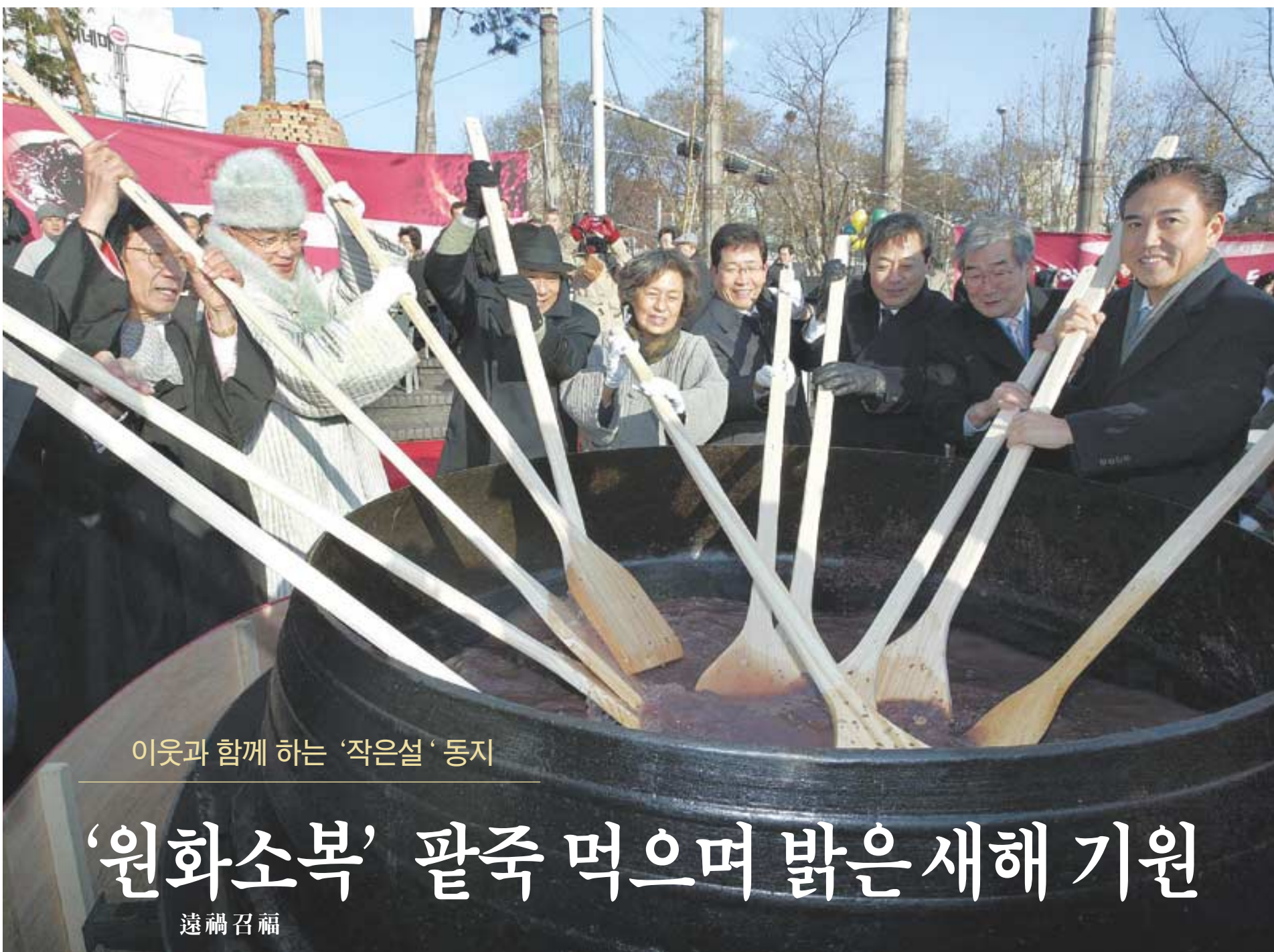
이웃과 함께 하는 '작은설' 동지