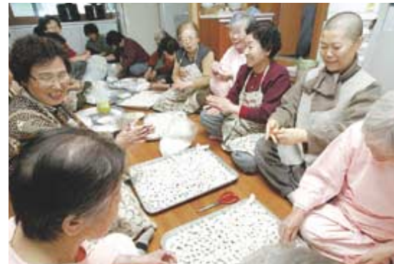
서울 수효사 주지 무구 스님이 요양중인 어르신들과 함께 새알을 빻고 있다.