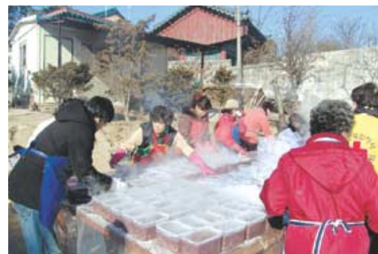
이동보육시설인 선재동자원은 팔 6가마니, 찹쌀 12가마니로 4000여명의 팔죽을 준비해 어려운 이웃들에게 전달했다.